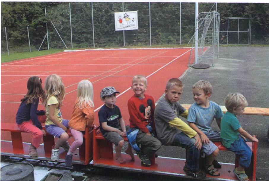
Immer ein Erfolg – die Hüpfburg (oben) und die Mini-Dampfbahn

„Petrus sei Dank“ konnten wir letztes Jahr das Spielplatzfest bei schönem Wetter durchführen. Für einmal mussten wir nicht lange überlegen, ob wir die Spielposten im Schulhaus oder auf dem Spielplatz aufbauen wollen, was die ganze Organisation doch um einiges erleichtert hat.