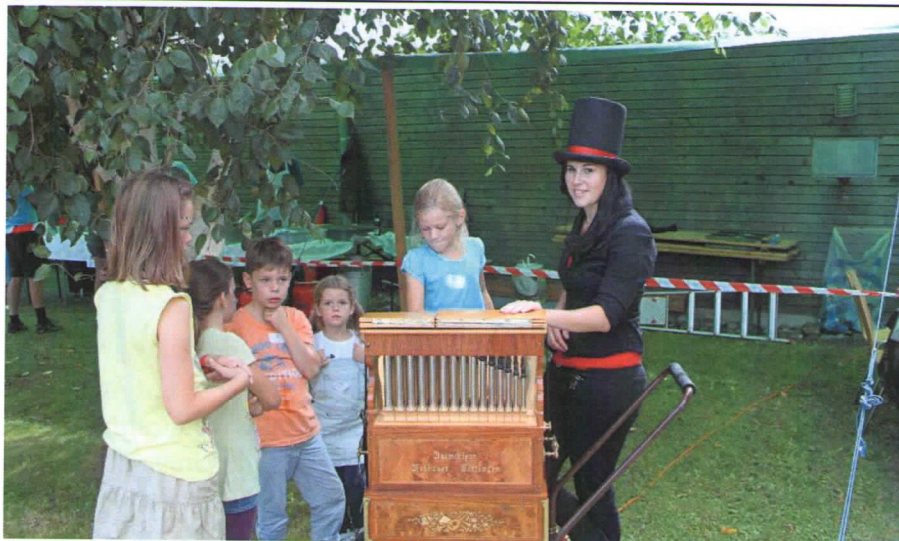
Das Drehörgeli war beliebt bei Gross und Klein (ganz oben), die Bastelecke (Mitte) und ein Highlight – das Koffertheater (unten)